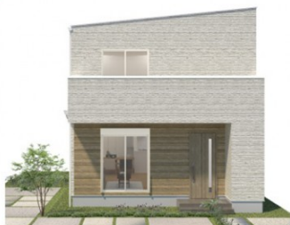
※この案内図面は略図です。図面と現況が異なる場合は現況優先となります。