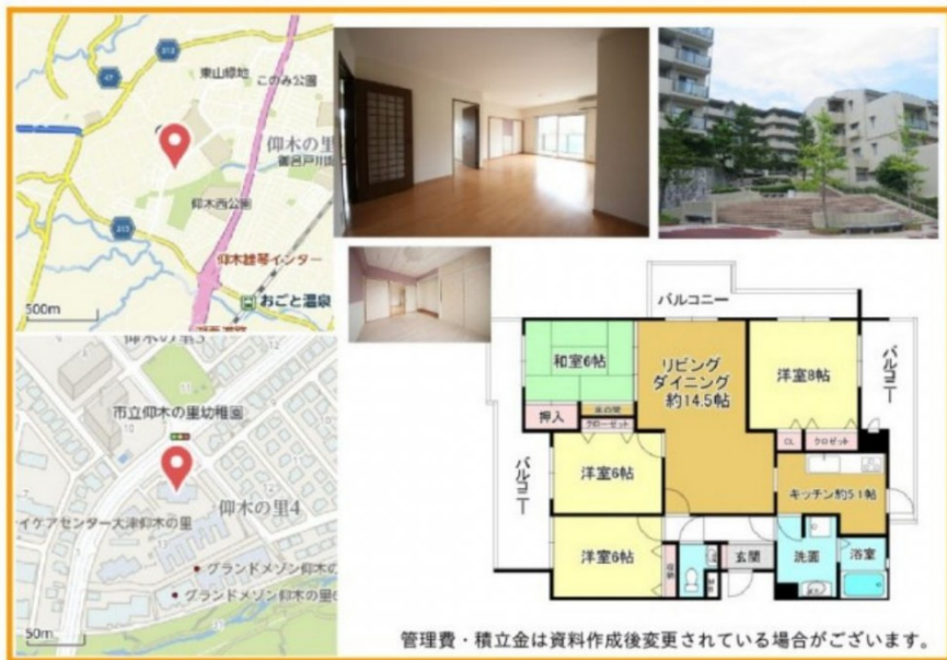
管理費・積立金は資料作成後変更されている場合がございます。